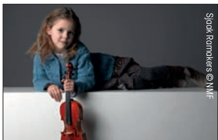
Sjaak Ramakers © NMF