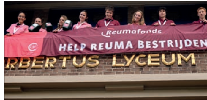
Help mee in de strijd tegen reuma als donateur of vrijwilliger.