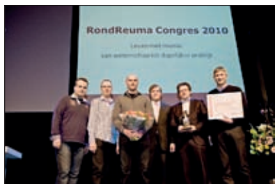
Uitreiking Support Award 2010 tijdens RondReuma Congres.